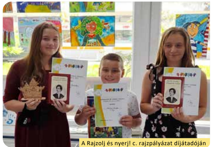
A Rajzolj és nyerd! c. rajzpályázat díjátadóján