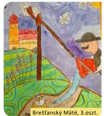
Breštánský Máté, 3.oszt.