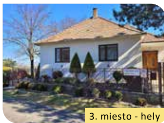
3. miesto - hely