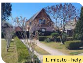
1. miesto - hely