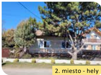
2. miesto - hely