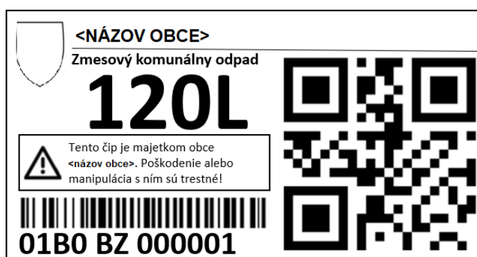
Ukážka potlače na obrázku nižšie je pre 120L nádobu ZKO.