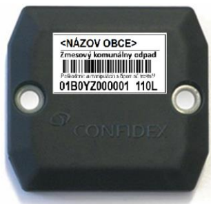
Vyrobený čip má rozmery 51 mm x 46 mm x 10 mm

Čipy na kovové nádoby sú umiestnené v plastovom obale, ktoré je potrebné ku nádobe prichytiť nerezovými nitmi. Každý čip má nálepku s potlačou, na ktorej je uvedený typ odpadu a objem nádoby.